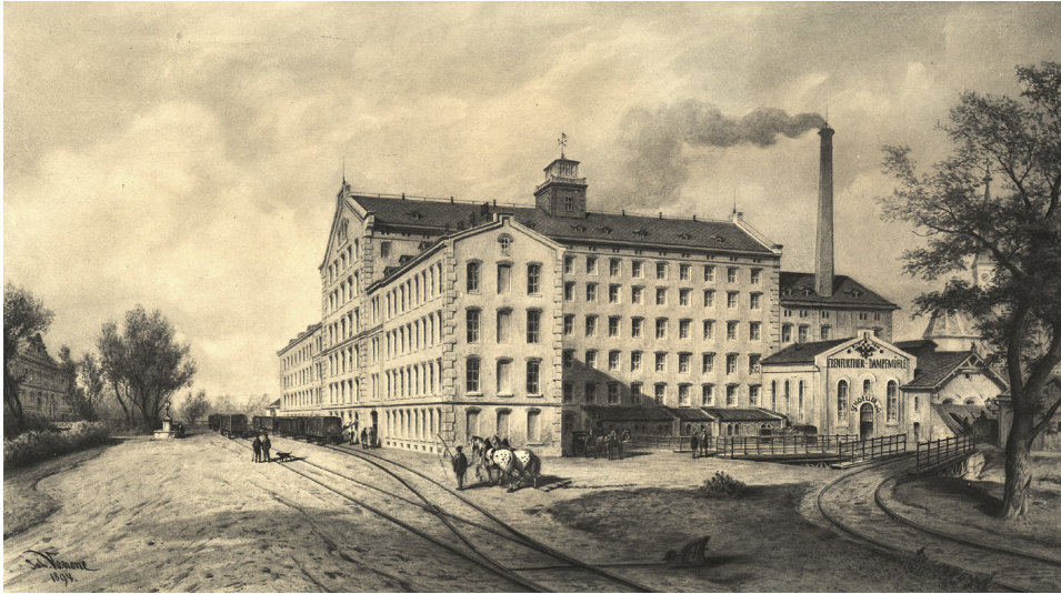
Abbildung 1: K. k. priv. Ebenfurth Dampfmühle von Schoeller & Co., Heliogravüre nach Aquarell von Giovanni Varrone, 1894, Niederösterreichische Landesbibliothek, Topographische Sammlung, 28.700.

Medaillen ausgezeichnet und es wurde „allgemein anerkannt, dass die Mahlproducte der gesammten österreichischen Griesmahlerei nicht allein vorzüglicher seien, sondern dass vorerst die ungarischen, dann die österreichischen Mühlen das absolut beste, feinste, reinste und weisseste Mehl erzeugen [...]“ 72